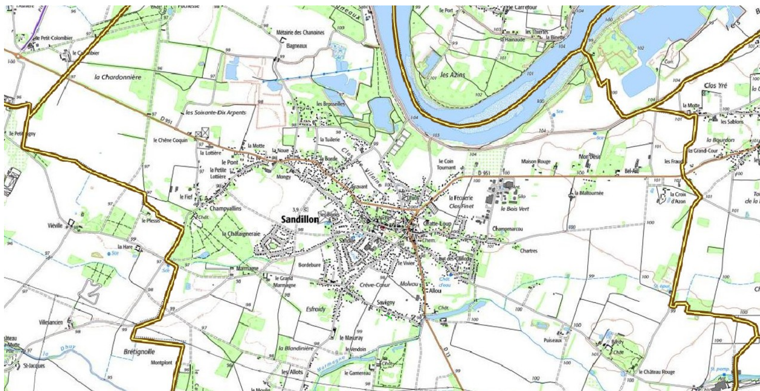
Illustration 1 : Localisation du projet

La commune de Sandillon est située dans le quart sud-ouest du département du Loiret, à environ 13 km au sud-est du centre d'Orléans. Elle couvre une superficie de 41,31 km 2 et comptait 4114 habitants en 2019 (Insee). Elle fait partie de la communauté de communes des Loges qui regroupe 20 communes pour plus de 42 600 habitants en 2019 (Insee).